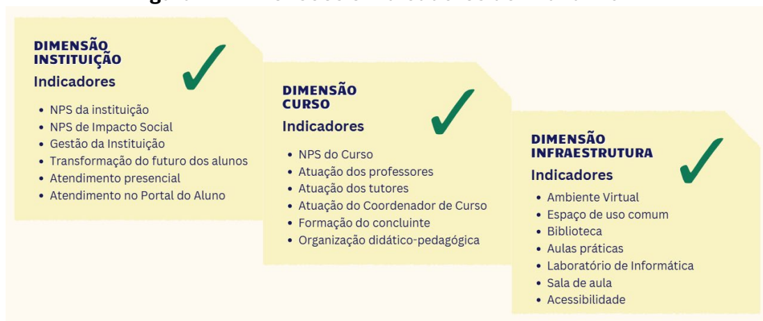
Figura 1 – Dimensões e indicadores do Avaliar 2024

Veja, a seguir, os indicadores de cada dimensão: