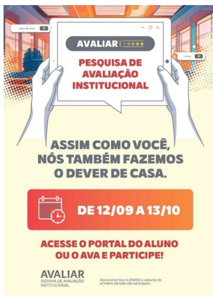
Figura 2 – Exemplo de sensibilização do Avaliar 2024