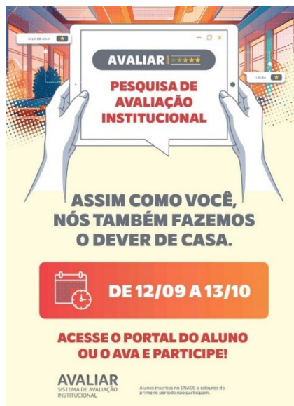
Figura 2 – Exemplo de sensibilização do Avaliar 2024

A participação e o engajamento da comunidade acadêmica no Avaliar são importantes para que tenhamos dados fidedignos à realidade de nossa Instituição. Por isso, antes e durante a aplicação do Avaliar, há ações de sensibilização para apropriação de discentes, docentes, técnico-administrativos e coordenações, que respondem aos questionários correspondentes ao respectivo segmento representativo.