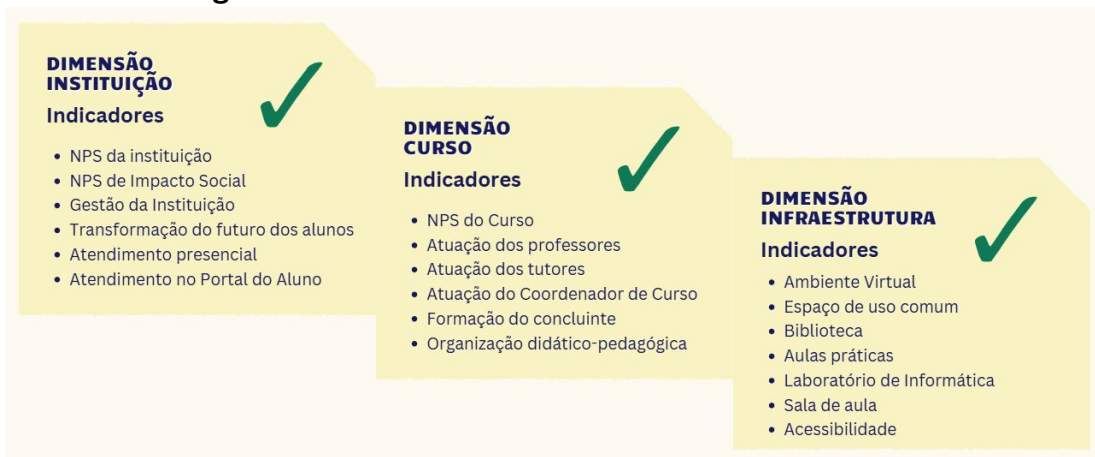
Figura 1 – Dimensões e indicadores do Avaliar 2024